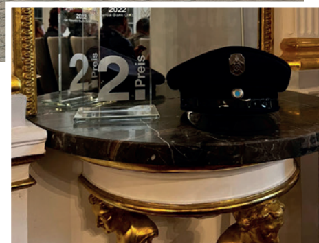
▲ Der 2. Ostbayerische Feuerwehrpreis 2022 für die Feuerwehr Teublitz für besondere Verdienste.